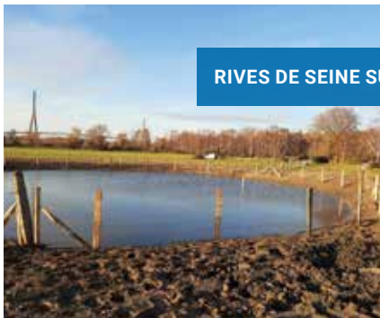
RIVES DE SEINE SUD

Le Conservatoire du littoral est propriétaire de 380 hectares sur ces deux sites littoraux en grande partie pâturée. L'abreuvement des animaux y est permis, mais n'est pas sans conséquences, car il provoque une