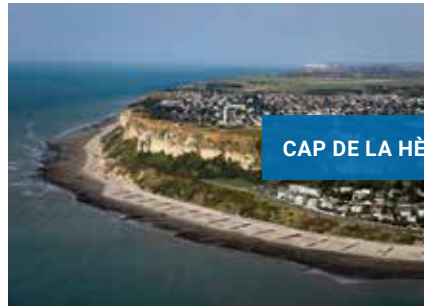
CAP DE LA HÈVE