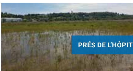
PRÉS DE L'HÔPITAL

Identifié comme zone d'intervention du Conservatoire du littoral en 1996, ce site de 55 ha, situé le long du cours de la Sée, est constitué de terrains en nature de prairies inondables et de cultures. L'acquisition de ces 9 ha supplémentaires, en partenariat avec la SAFER de Normandie, porte à 15 ha le domaine protégé par le Conservatoire du littoral. Cette acquisition permet de constituer une unité fonctionnelle de gestion qui vient compléter les propriétés de la Fondation Nationale de la Faune Sauvage (25 ha). Le site est géré par la Fédération départementale des chasseurs de la Manche, avec le Syndicat Mixte des Espaces Littoraux - SyMEL (gestionnaire des terrains du Conservatoire du littoral dans la Manche). Cette acquisition bénéficie du soutien de l'Agence de l'Eau Seine-Normandie.