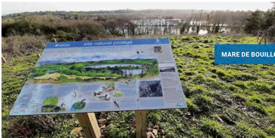
MARE DE BOUILLON

permettre aux visiteurs de découvrir ce site, tout en préservant ce havre de quiétude. La première étape de valorisation s'est traduite par l'implantation d'un panneau le long d'un chemin de randonnée situé sur un point haut à l'extérieur du site. Ce panneau doit permettre au public de comprendre la valeur écologique du site, la fragilité des milieux humides et le rôle de la mare pour les oiseaux, la flore et la faune spécifique au site.