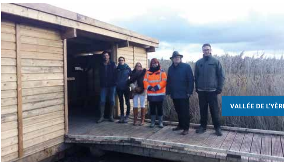
VALLÉE DE L'YÈRES

barrières y ont été installées pour permettre un entretien par du pâturage extensif. Une signalétique pédagogique y sera placée pour informer et sensibiliser le public à la préservation des zones humides et la biodiversité. Cette opération a bénéficié d'une aide de l'Agence de l'Eau Seine-Normandie.